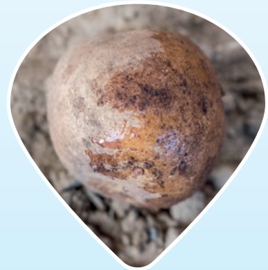
Säätövirhe, peittävyys jäänyt huonoksi

Varmista kasvinsuojelaineen turvallinen käyttö. Lue aina pakkausmerkinnät ja tuotetiedot ennen käyttöä.