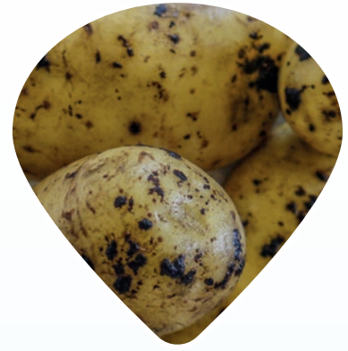
Perunaseitin aiheuttama seittirupea

Valmistetta ei saa käyttää varhaisperunalla, koska se aiheuttaa siihen makuvirheitä.